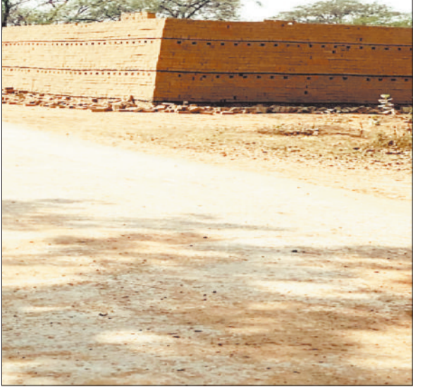
अवैध रूप से संचालित ईट भट्टा।