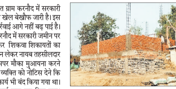
सरकारी जमीन पर हो रहे अतिक्रमण।

तालदेवरी। बम्हनीडीह तहसील अंतर्गत ग्राम करनोद में सरकारी जमीन पर अवैध कब्जे और निर्माण का खेल बेखोफ जारी है। इस पर नोटिस देने के बाद भी अब तक कार्रवाई आगे नहीं बढ़ पाई है। मिली जानकारी के अनुसार ग्राम करनोद में सरकारी जमीन पर अतिक्रमण कर मकान बनाने को लेकर शिकवा शिकायतों का दौर चला। इसके बाद एसडीएम ने सज्ञान लेकर नायब तहसीलदार को जांच करने के निर्देश दिये थे जिसपर मौका मुआयना करने पटवारी कि टीम पहुंची थी और संबंध व्यक्ति को नोटिस देने कि बात सामने आई थी, कुछ दिन निर्माण कार्य भी बंद किया गया था। वही अब पुनः व्यक्ति द्वारा निर्माण कार्य शुरू कर दिया गया। जिससे प्रशासन कि कार्यप्रणाली पर बड़ा सवाल उठ रहा है। दरअसल पूरा मामला बम्हनीडीह तहसील क्षेत्र के करनोद का है जहां खसरा नंबर 2335 का है, जो राजस्व आवंटियों में छत्तीसगढ़ शासन के नाम दर्ज शासकीय भूमि है। यहां मिसदा निवासी एक व्यक्ति द्वारा लगभग 230 वर्गमीटर क्षेत्र में अवैध कब्जा कर पक्का मकान निर्माण किया जा रहा है। जानकारी मिलने पर नायब तहसीलदार द्वारा निर्माण रोकने का नोटिस जारी किया गया, जिसमें तत्काल कार्य बंद करने, न्यायालय में उपस्थित होने और आदेश की अवहेलना पर दंडात्मक कार्रवाई का स्पष्ट उल्लेख