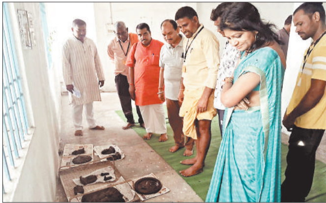
कार्यक्रम को संबोधित करते अतिथि एवं गौ उत्पाद से निर्मित वस्तुओं का किया अवलोकन।