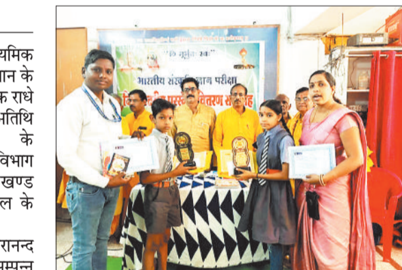
सम्मानित करी अतिथि।