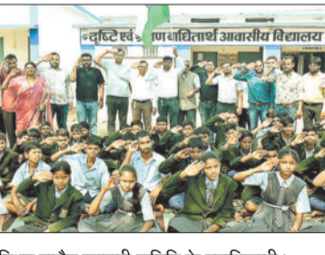
बच्चों के साथ उपस्थित राहौद व्यापारी समिति के पदाधिकारी।

व्यक्त करते हुए समिति सदस्यों को सरोपचार, पुष्पमाला, प्रशस्ति पत्र एवं धन्यवाद पत्र प्रदान कर सम्मानित किया। विद्यालय प्रबंधक मंडल ने अपने वक्तव्य में कहा कि यह कार्य केवल भौतिक सुधार नहीं, बल्कि सामाजिक जनसेवा की सच्ची भावना का परिचायक है। उन्होंने आशा व्यक्त की कि जनसहयोग, सामाजिक संस्थाओं के समर्थन तथा प्रशासन की अनुशंसा और सहयोग से ऐसे समावेशी मॉडल विद्यालय पूरे छत्तीसगढ़ में स्थापित हों, ताकि विशेष आवश्यकता वाले प्रत्येक बच्चे को समान, सुरक्षित और सम्मानजनक शैक्षणिक वातावरण प्राप्त हो सके। विद्यालय प्रबंधन ने प्रशासन से भी आग्रह किया कि इस प्रकार की पहल को प्रोत्साहन एवं मार्गदर्शन प्रदान किया जाए, जिससे यह मॉडल राज्य स्तर पर विस्तारित हो सके।