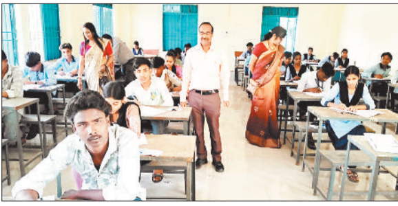
परीक्षा केन्द्र का निरीक्षण करते उडनदस्ता टीम।

छत्तीसगढ़ माध्यमिक शिक्षा मंडल द्वारा संचालित 10वीं बोर्ड अंग्रेजी विषय की परीक्षा में शामिल होने के लिए 13 हजार 469 छात्र छात्राओं ने आवेदन जमा किए थे। जिसके तहत 13 हजार 27 छात्र छात्राएं बोर्ड परीक्षा में शामिल हुए। वहीं 442 छात्र परीक्षा से अनुपस्थित रहे। मंगलवार 24 फरवरी को जिले में संचालित हाई स्कूल सर्टिफिकेट परीक्षा में कक्षा 10वीं विषय अंग्रेजी की परीक्षा सुचारू रूप से संचालित हुई। जिले में परीक्षा में उपस्थित एवं अनुपस्थित छात्र छात्राओं की संख्या इस प्रकार है। अकलतरा में